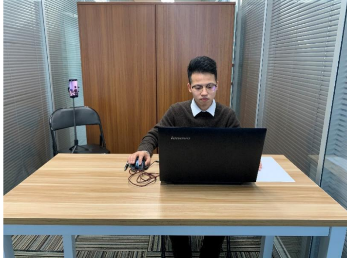
图一：电脑端正面视角