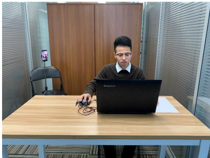
图一：电脑端正面视角

(4) 考试开始前，考生需要先登录移动端“智考通”，用前置摄像头 360 度环绕拍摄考试环境，随后将移动设备固定在能够拍摄到考生桌面、考生电脑屏幕内容、周围环境及考生行为的位置上继续拍摄（详见说明书中《智考通操作手册》《智考云在线考试规范》）。