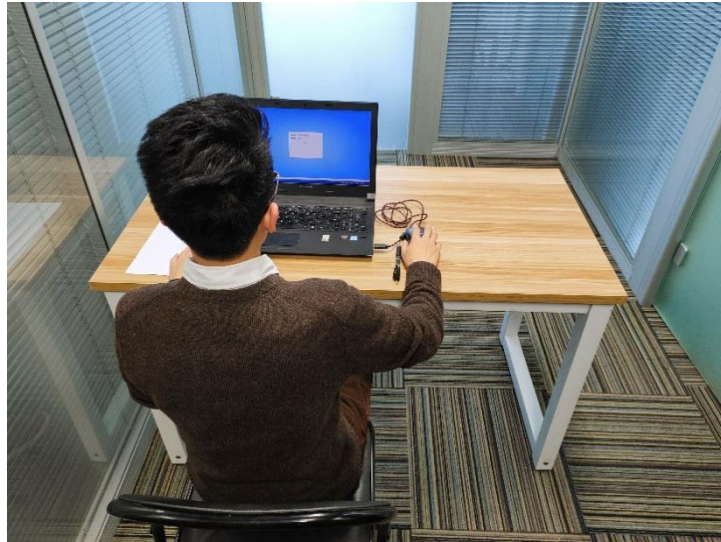
图二：电脑端背面视角